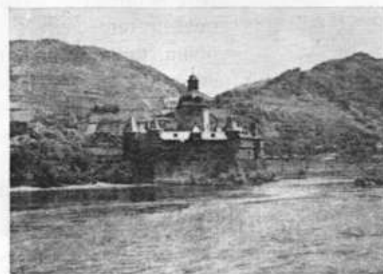
Die Pfalz im Rhein