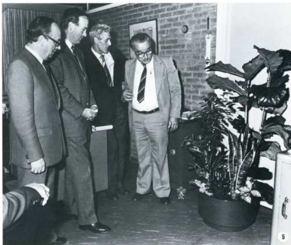
foto 5 Voor de ogen van de toeschouwers verscheen een zeer fraai opgemaakte plantenbak. Een blijk van waardering die aandacht blijft vragen.