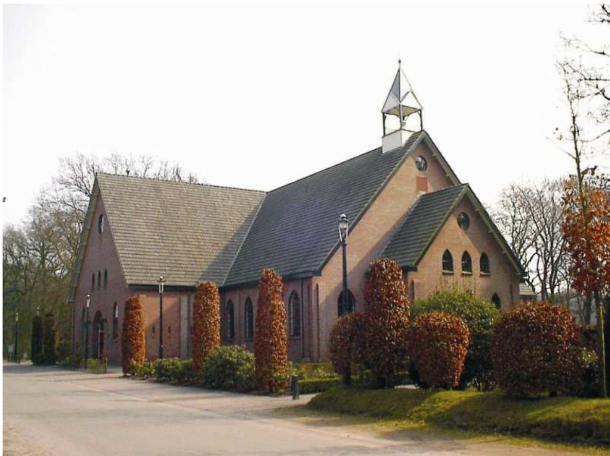
De kerk van de Gereformeerde Gemeenten in Nederland in De Beek.