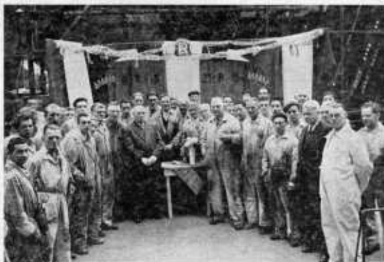
(Zie Augustus-nummer van de Wekker)