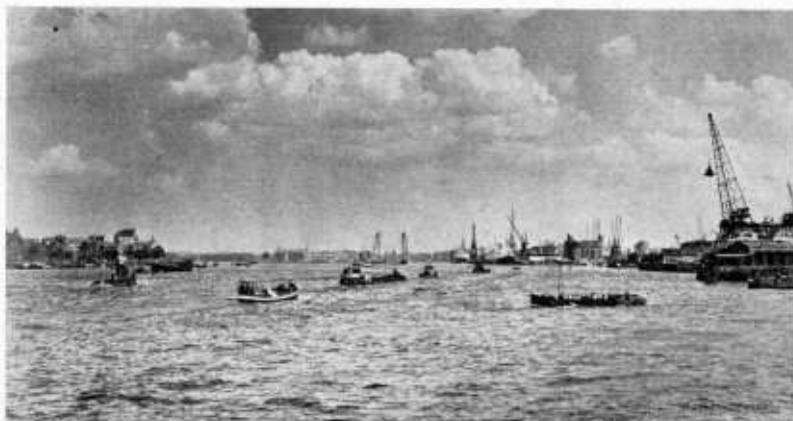
Vanaf het fraaie plantsoentje, op de zuidelijke oever van de Nieuwe Maas bij het ventilatiegebouw van de tunnel, heeft men een prachtig gezicht op onze rivier, zowel naar oost als west, en bovendien het zon- netje in de rug of op zij. Op deze foto, genomen bij dit plantsoen, zien we over de rivier naar het oosten.